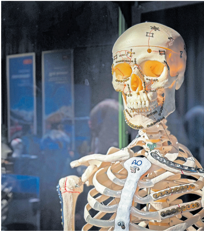
Das Kunstskelett ist mit Implantaten zur Heilung von Knochenbrüchen bestückt.