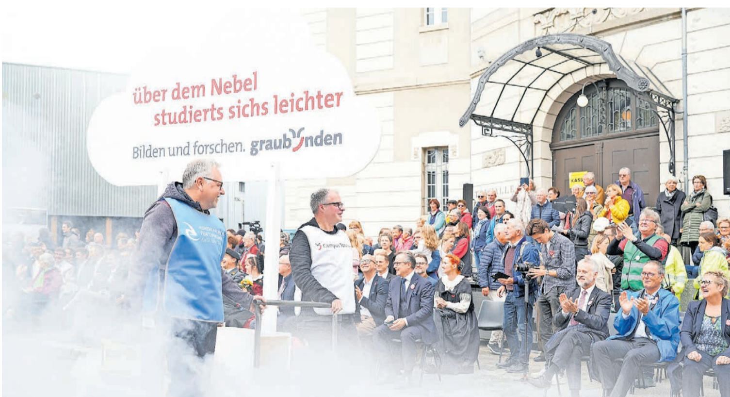
Über dem Nebel studiert es sich leichter – die Botschaft brachte manch ein Schmunzeln hervor.

Dort studieren, wo andere Ferien machen. Graubünden bietet unerwartete Perspektiven im Bereich Bildung und Forschung; Bildungsgänge, die schweizweit einmalig sind, und konkurrenzlose Spitzenforschung mit weltweiter Anerkennung. Von Christian Ehrbar