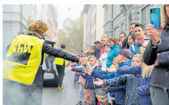
Der Wissensdurst der Zuschauer wurde am Festumzug fleissig gestillt.