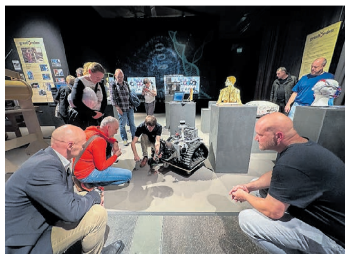
Das Publikum zeigte sich sehr interessiert an den Exponaten, hier wird der Rettungsroboter «boarAI» erklärt.