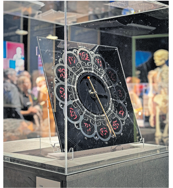
Eine Uhr, die ohne Fremdenergie und ohne Abnutzung endlos lange läuft.

Bildungsmarketing: «Wir sind begeistert, dass alle diese Forschungs- und Bildungseinrichtungen sich dermassen intensiv für die Erlebnisswelt Graubünden eingesetzt haben.» Dies sei insofern nicht selbstverständlich, da sich die Institutionen speziell für das nichtwissenschaftliche Publikum vorbereiten mussten.